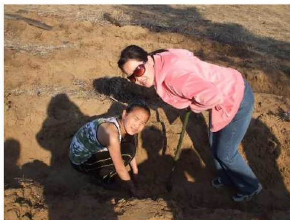
写真 6. 植林作業