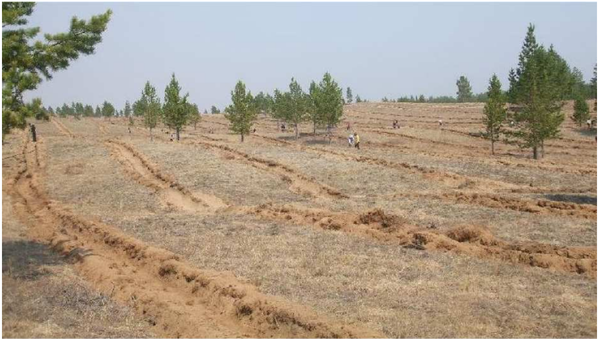
写真 1. 植林地遠景