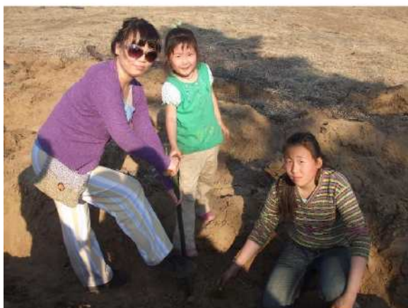
写真 5. 植林作業