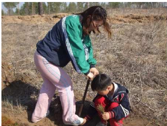
写真 3. 植林作業