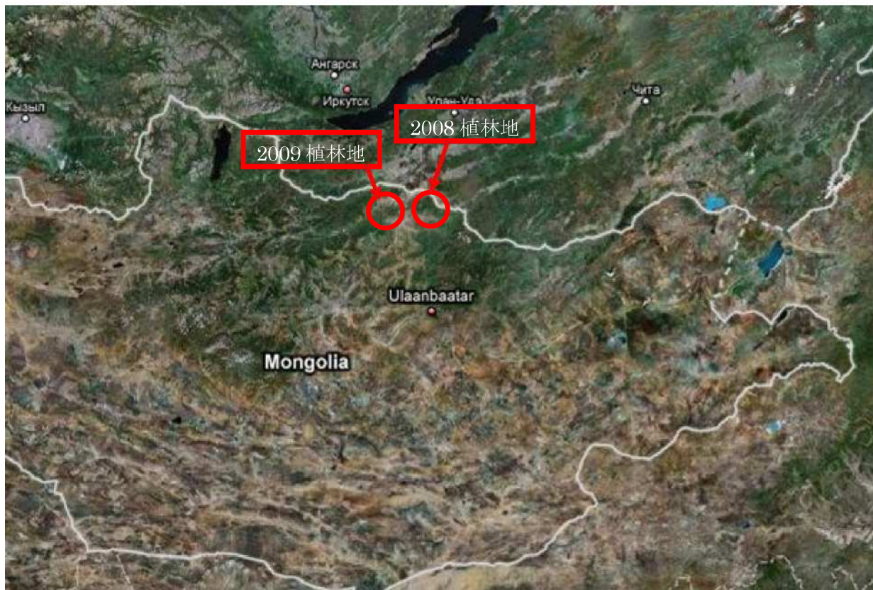
図1. 広域図（2008, 2009年植林地）