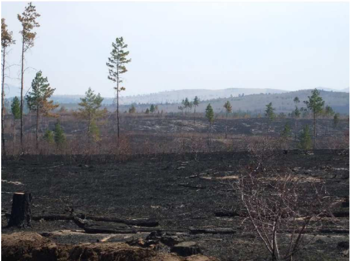
写真 2. 植林地遠景（直近の森林火災跡地）