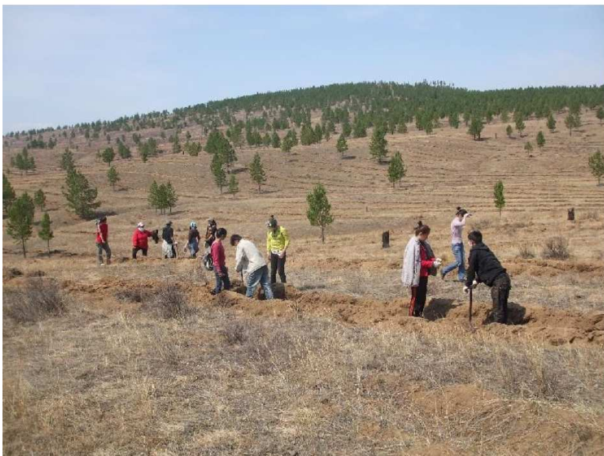
写真 9. 植林作業風景