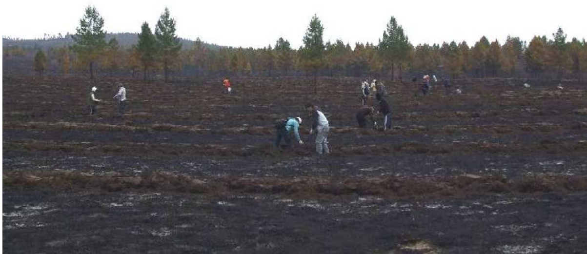
写真 8. 植林作業風景