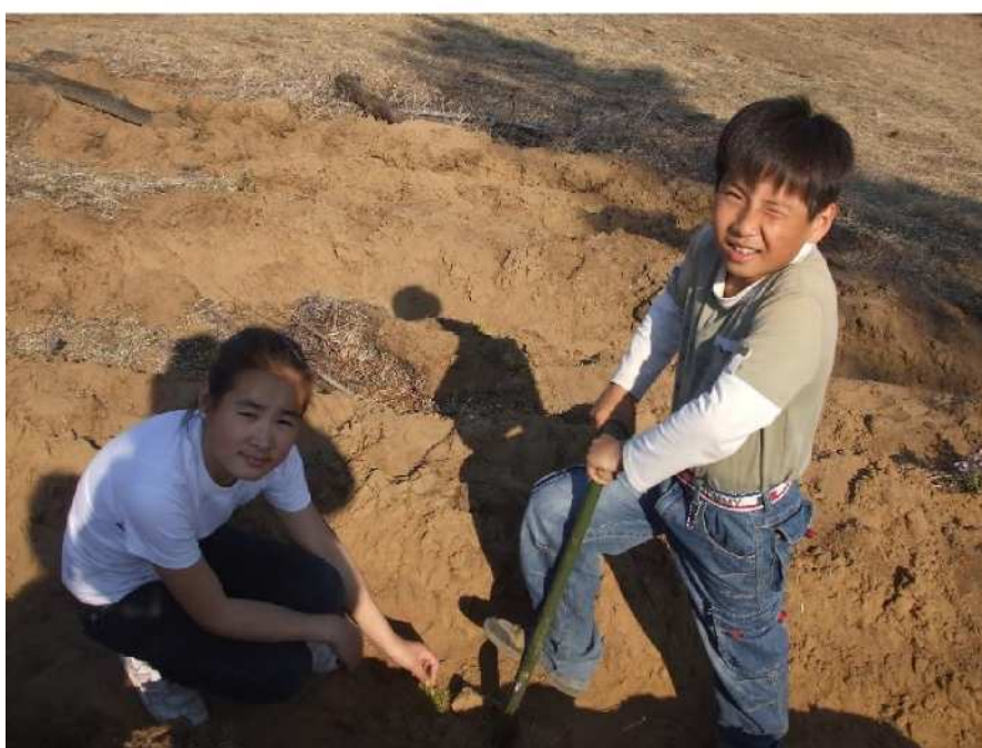
写真 7. 植林作業