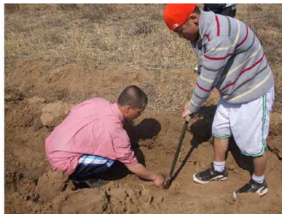
写真 4. 植林作業