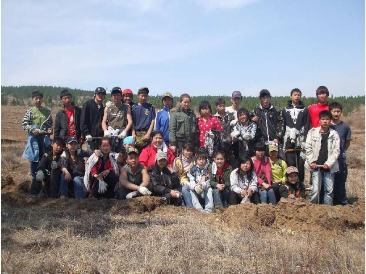
写真 10. 集合写真